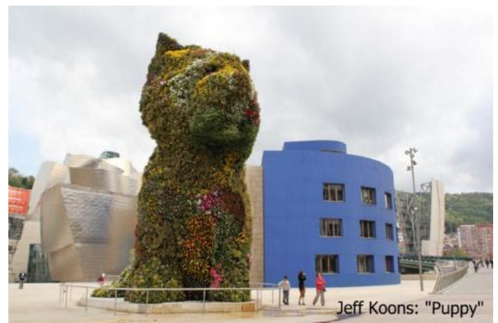
Jeff Koons: "Puppy"

tetty kalan suomuja muistuttavilla puolen millin paksuisilla titaanilevyillä. Museon ulkopuolella on "Puppy" lisäksi mielenkiintoisia taideteoksia: mm. Louise Bourgeoisin valtava hämähäkki "Maman" ja Jeff Koonsin värikäs seitsemän tulppaanin kimppu "Tulips".