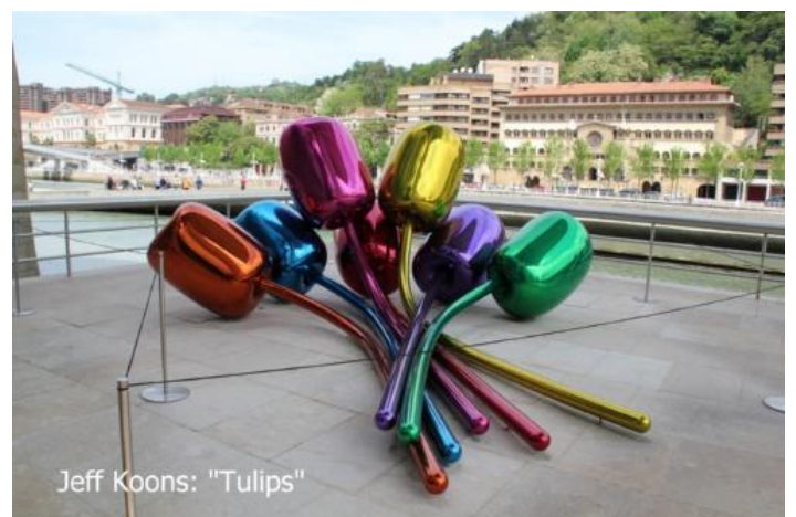
Jeff Koons: "Tulips"